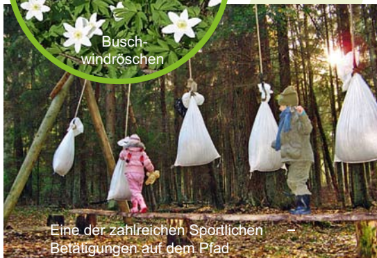
Eine der zahlreichen sportlichen Betätigungen auf dem Pfad