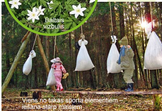
Viens no takas sporta elementiem – iešana starp maisiem