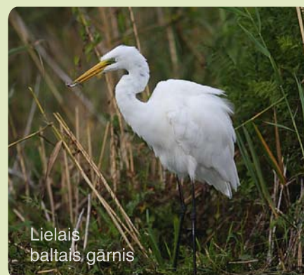
Lielais baltais gārnis